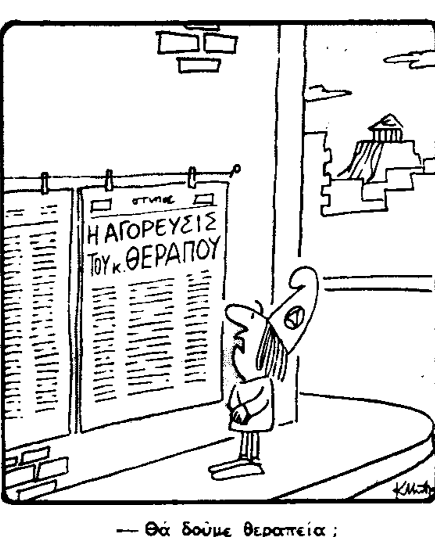
Θά δούμε θεραπεία; (Του Κωστή Μπαρδούλη)