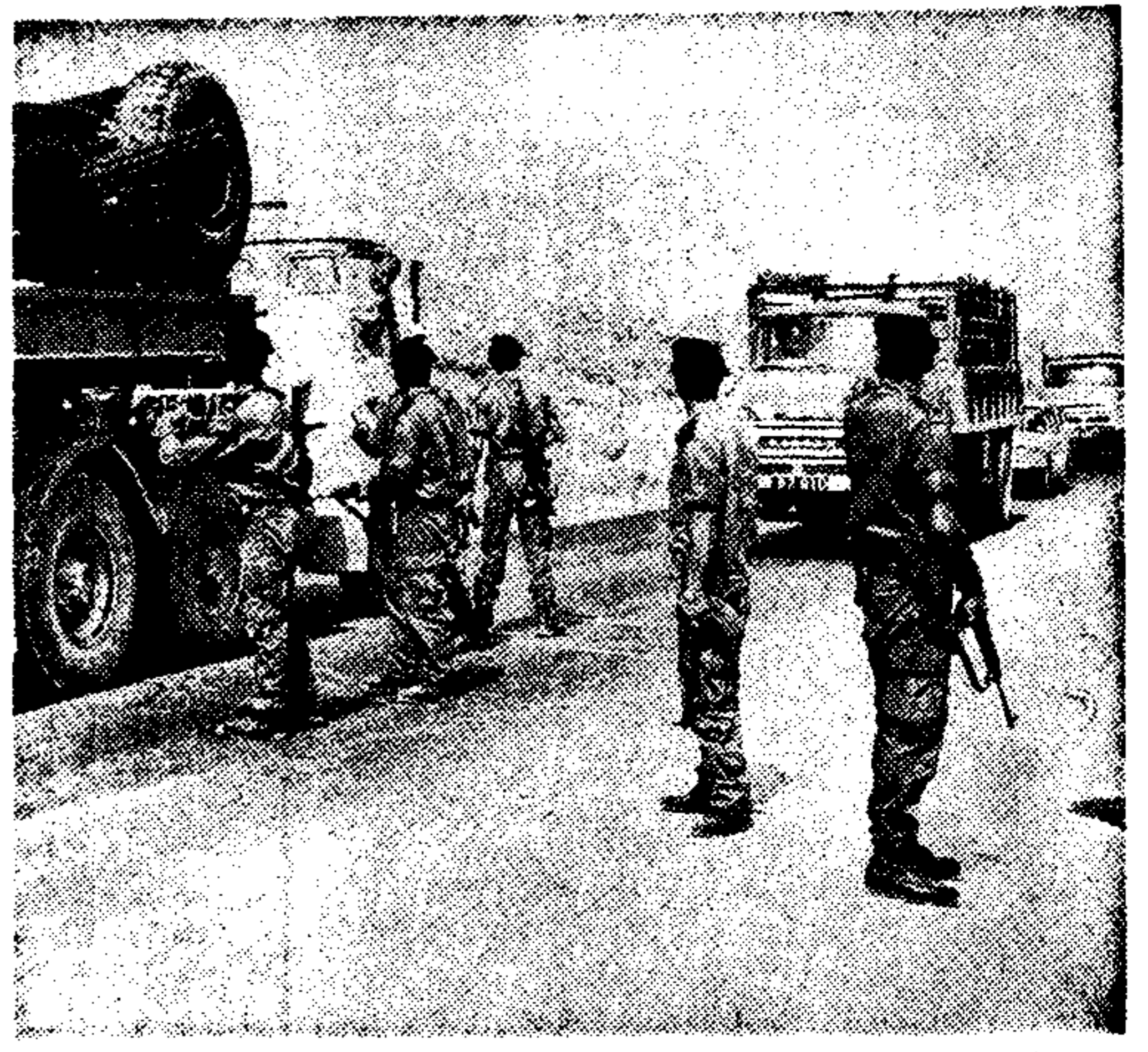
Άνδρες του εθνικού Σώματος της κυπριακής αστυνομίας έρευνούν όλα τα όχηματα στη δημοσία οδό Λευκωσίας...